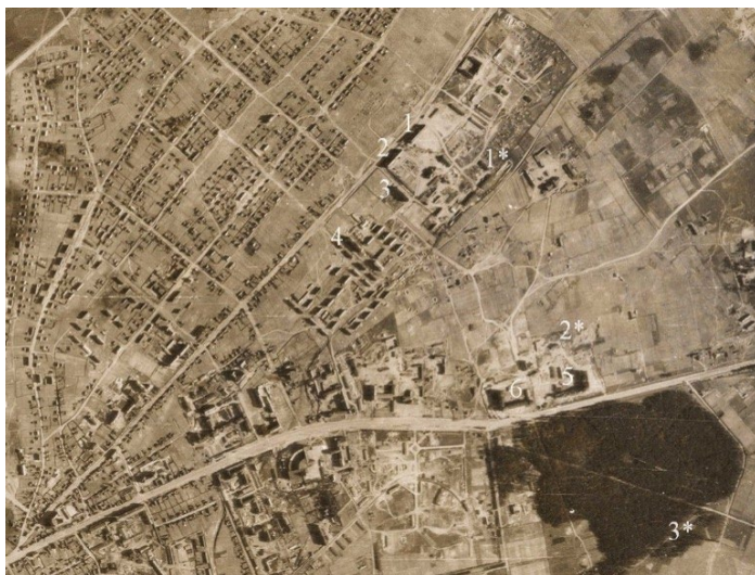
Рис. 3. Лазарет Пушкинские казармы Небенлагеря Ролльбан Шталага 352, г. Минск на аэрофотосъемке 1944 г.

Небенлагерь Ролльбан Шталага 352, а также его лазарет Пушкинские казармы оставили после себя 3 воинских захоронения: № 1* – неучтенное воинское захоронение лазарета Пушкинские казармы (р-н пер. Калинина), № 2* и № 3* – учтенные воинские захоронения небенлагеря Ролльбан (№ 1136, г. Минск, ул. Толбухина и № 1142, г. Минск, парк им. Челюскинцев) (рис. 3).