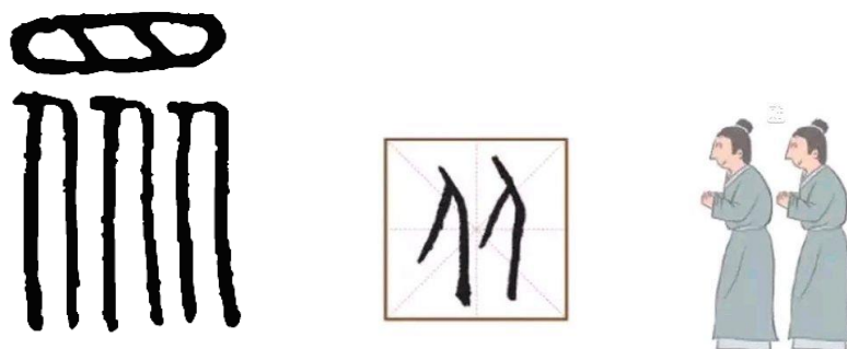
Рис. 2. Иероглиф 众 в письменах Цзягувэнь

14. Структура «в форме трех графем “рот” / в форме трех квадратов» (品字结构): 森, 众, 嘉. Для определения отнесенности компонентов логограмм данного типа структуры к Инь и Ян мы также обратились к этимологии логограмм. Например, логограмма 众. В письменах Цзягувэнь она передавала изображение 目, который навис над 彳, образуя структуру «сверху вниз» (上下结构). Вследствие чего компонент, находящийся в верхней части логограммы, а именно 目, относится к Ян, находящийся в нижней части логограммы 彳 – к Инь (рисунок 2).