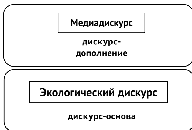
Рис. 2. «Гибридизация» экологического медиадискурса

дискурсов порождает качественно новые виды дискурса, не сводимые к механической сумме их составляющих. Дискурс-основа определяет содержание дискурса, дискурс-дополнение – сферу его функционирования, которая накладывает отпечаток на его форму. Исходя из данной позиции, институциональные дискурсы имеют тенденцию к «гибридизации», при этом под гибридным дискурсом понимается «совокупность компонентов различных институциональных форматов дискурса, концентрация и взаимопроникновение которых в значительных пределах может варьировать» [4, с. 8]. Применительно к экологическому медиадискурсу ввиду того, что обе его составляющие являются институциональными типами дискурса, можно говорить о его гибридной природе. При этом дискурсом-основой выступает экологический дискурс, поскольку представляет собой набор текстов, объединенных общей темой «Экология», а дискурсом-дополнением – медиадискурс, репрезентирующий медийную сферу функционирования текстов и являющийся формой представления экологической проблематики (рис. 2).