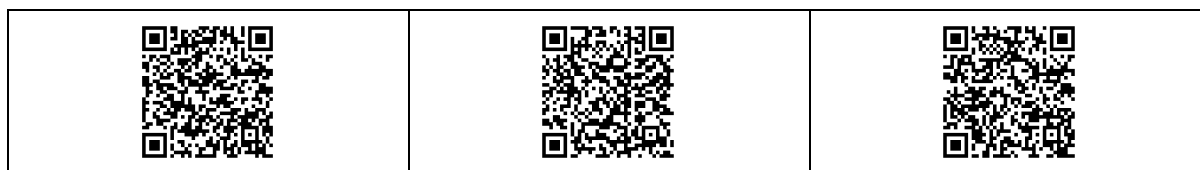
Рис. 3 примеры интерактивных плакатов учащихся

В качестве примера можно привести задание для учащихся 10 класса. При обобщении материала по теме «Belarus» учащимся было предложено создать и презентовать свои интерактивные плакаты. Ребята по своему желанию работали в парах или самостоятельно. В 11 классе учащиеся составляли интерактивный плакат с последующей презентацией по теме «The USA and Canada».