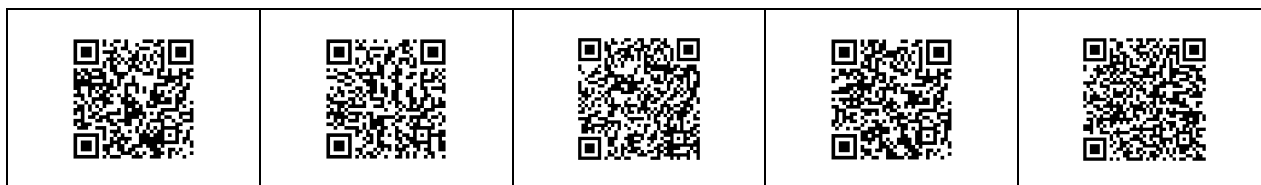
Рис. 2 примеры выполнения учащимися заданий на онлайн-доске linoit

Еще одним широко распространённым сервисом WEB 2.0, часто используемым в современной школе, является интерактивный плакат. Интерактивный плакат является универсальным средством визуализации информации, где могут располагаться задания различных форматов: в виде текста, фотографий, картинок видео, таблиц, ссылок на интернет-источники. Интерактивный плакат может выступать средством обучения, которое позволяет вовлечь обучаемого в процесс получения знаний, способствует созданию условий для развития умений говорения, обеспечивает максимальную наглядность информации.