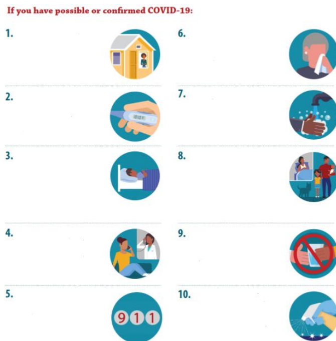
Рисунок 3. Упражнение на заполнение пропусков

К примеру, при изучении темы «Health» учащимся второго курса предлагалось заполнить пропуски со своими собственными мыслями в соответствии с изображением, используя активную лексику из юнита.