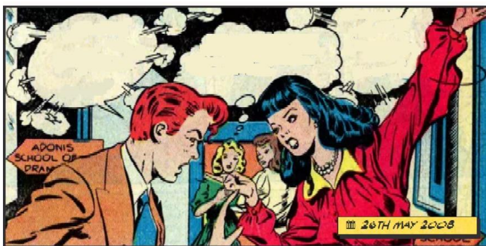
Рисунок 4. Заполнение выносок реплик

В процессе повторения лексики по разделу «Relationships» учащимся четвертого курса предлагалось заполнить выноски реплик в комиксе, используя свои собственные идеи, а затем обсудить полученные результаты в группах.