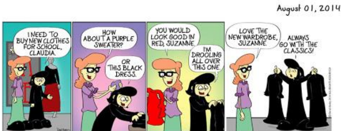
Рисунок 2. Задание для монологического высказывания

2) Have a look at the comics given below. You are going to give a talk about how you usually buy clothes. You will have to start in 1,5 minutes and will speak for not more than 2 minutes (about 20 sentences).