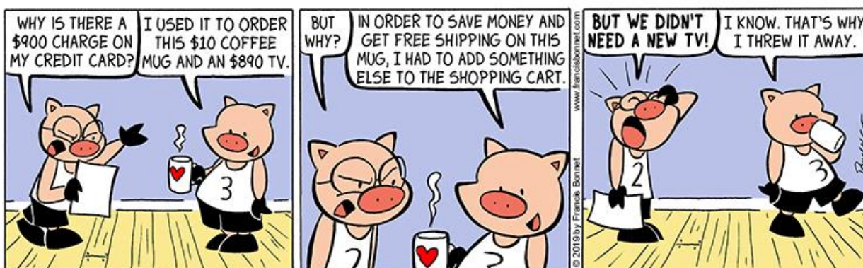
Рисунок 1. Задание для письменной части

1) Have a look at these comics and write an essay on the given topic: «How to avoid spending money on useless things?»