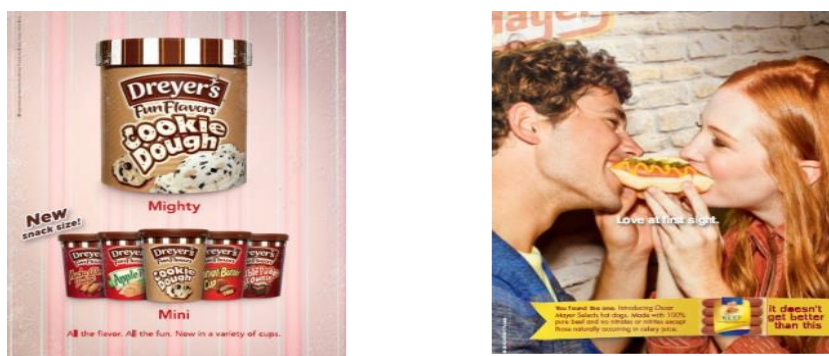
Рисунок 7. Изображения с рекламой к упражнению