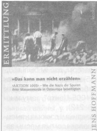
Вокладка кнігі Е.Хофмана.

ся вайны стаў адным са сведак на судовым працэсе супраць асобных удзельнікаў "зондэркаманды-1005". Е.Хофман прыводзіць біяграфію Л.Гутмана. Адзначае, што ён нарадзіўся ў 1902 г. у Вюрцбургу, дзе перад вайной гандляваў хатняй жывёлай. 24 лістапада 1941 г. разам з жонкай і сынам і іншымі амаль 1020 яўрэямі (мужчынамі, жанчынамі і дзецьмі) ён быў адпраўлены "на Усход". Месцам прызначэння значылася Рыга. Праз 5 месяцаў, 8 мая 1942 г., ён разам з сябрам Тэа Дзёленфельдам быў дастаўлены цягніком з 34 галовамі буйной рагатай жывёлы ў Малы Трасцянец. Апроч іх з лагера Саласпілс у Трасцянец прыбыў і першы камендант лагера Г.Майвальд. Сябры апынуліся ў розных месцах. Тэа быў прызначаны адказным за правядзенне сельскагаспадарчых работ, а Л.Гутман павінен быў кіраваць жывёлагадоўляй у гаспадарцы мінскага СД у Трасцянец. Л.Гутман на судовым працэсе ў 1962 г. сведчыў, што заставаўся ў лагера Малы Трасцянец да ўцёкаў 29 чэрвеня 1944 г. На той момант у яго гаспадарцы было 127 кароў, 132 свінні, 70 коней, 300 авечак і інш. Працавалі ў ёй пераважна яўрэі, якія знаходзіліся ў працоўным лагера. Працаваць даводзілася шмат, фактычна часу не заставалася для таго, каб даведацца пра іншыя падзеі ў лагерах. Аднак Л.Гутману давялося выдзяляць коней у распараджэнне мясцовых вязняў лагера, якія атрымалі заданне разам з сялянамі вёскі Малы Трасцянец і ваколіц нарыхтоўваць дровы для спальвання парэшткаў забітых ва ўрочышчы Благаўшчына (S. 200).