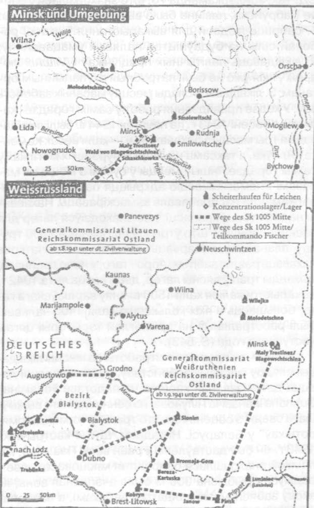
Зона дзейнасці "зондэркаманды 1005-Цэнтр" на тэрыторыі "Мінска і ваколіц", Беларусі. Пазначаны "штабелі для спальвання трупам", "канцлагеры і лагеры", шлях гэтай каманды.

цыі Бабруйска, Гомеля і Віцебска, быў аддадзены загад, паводле якога кожная з вышэйзгаданых структур стварала спецыяльнае падраздзяленне для "агідных работ", правядзенне якіх мусіла забяспечвацца шляхам прыцягнення вязняў з бліжэйшых лагераў. Апроч таго, у той жа дзень каля вёскі Пашкава побач з Магілёвам было арганізавана "паказальнае спальванне" трупам 100 мясцовых грамадзян (расстрэляных перад гэтым), складзеных у спецыяльнае вогнішча, падчас якога прысутнічалі таксама прадстаўнікі каманд СД з Бабруйска, Гомеля, Віцебска, Магілёва і Мінска. У якасці найбольш прымальнай метадыкі ўтрымання работнікаў спецыяльных каманд было прапанавана выкарыстоўваць "кіеўскую мадэль", паводле якой прыцягнутыя да работ вязні цягам дня павінны былі знаходзіцца пад пастаяннай аховай, а ўначы размяшчаліся ў спецыяльна пабудаваных зямлянках, іх прымацоўвалі адзін да аднаго пры дапамозе лан-